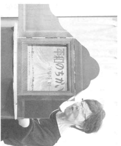
広島原爆の紙芝居

平和な世界を目指し、高校生や大学生による実行委員会が「8・6平和の心 マッセージコンサート」を社会福祉法人・まるご福祉会の方よりホールで開いた。戦争体験者の講演や児童による平和を願う作文の発表など、各世代が発表した。